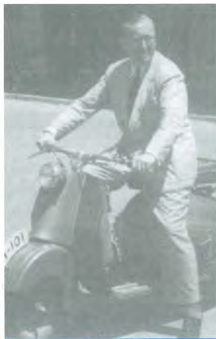
Una scooter al servei de la pediatria. Manresa, finals dels anys 40.

■ El moment era complex i hi va haver de tot, però va influir moltíssim el que estiguéssim a la residència, perquè el que no he dit abans és que existia també l'Agrupament Escolar de l'Acadèmia del Laboratori de Ciències Mèdiques al Casal del Metge, on feien cursets de disci-