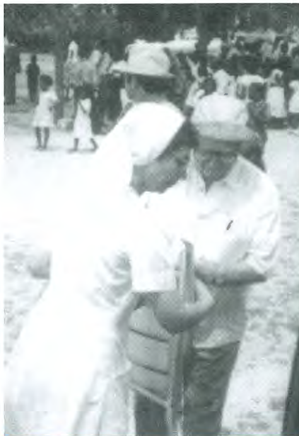
Sortint de missa a Mont Rolland, poblet prop de Thies (Senegal).

“ El metge pediatre, suposo que com els altres, es folrava de llibres per poder consultar en tot moment el que convingués: les dosis, els símptomes i les complicacions... ”