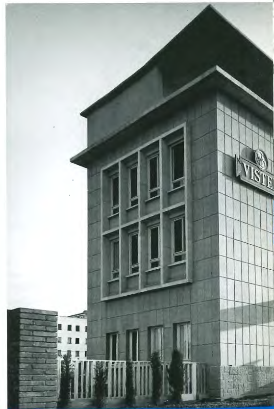
Edifici del laboratori Drovysa-Vister, al carrer Escocia, 4

Després de Brunete, la 13 Brigada a la qual jo servia va quedar tan delmada que es va negar a anar al front. Llavors el cap de la Brigada, va quadrar un soldat, el qual va respondre que abans de tornar al front volia anar a descansar; el cap va disparar un tret i el va matar. La gent es va amotinar... Un daltabaix... I van dissoldre la brigada. Es clar, jo em vaig quedar, entre comeses, "sense feina". Llavors em van donar l'ordre d'anar a Albacete, al Quarter General. Això era finals de juliol del