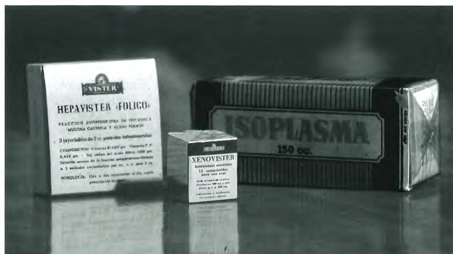
Isoplasma i altres productes del Laboratori Drovysa-Vister.

■ Es fugia de l'hospital. L'hospital tenia mala fama: era símbol de pobresa i injustícia social. Els sindicalistes no volien hospitals. Els hospitals, amb l'eufemisme característic del règim, els deien residencias sanitarias . I a més, de la mateixa manera que els rics eren visitats pel metge al seu despatx, i operats a la seva clínica, ells també