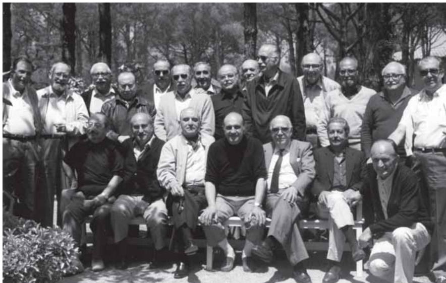
Companys de la promoció 44 es retrobaven un cop l'any. Aquesta foto correspon a la trobada de la primavera de 1983 a l'hotel Garbí, de Calella de Palafrugell.

“ Va votar tothom i em van proclamar per unanimitat president electe de la International Federation of Physical Medicine i llavors jo ja vaig preveure que el 72 tindríem el congrés a Barcelona, del 2 al 7 de juliol. ”