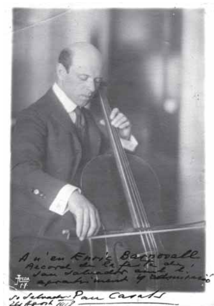
Pau Casals dedicà aquesta fotografia en "record de la festa de San Salvador amb l'agrahiment i admiració", el 24 d'agost de 1918, tres mesos abans de néixer en Francesc Barnosell.

necessitat de cap carril-bici, pel mig de la calçada com la cosa més natural. Llavors un dia, el 19 de juliol, me'n recordo que era diumenge, vaig sortir de casa amb la bicicleta en direcció a Montjuïc per a entrenar-me i vaig sentir espetecs i vaig pensar: "Això deu ser la inauguració de l'Olimpiada Popular", olimpiada que com és lògic es