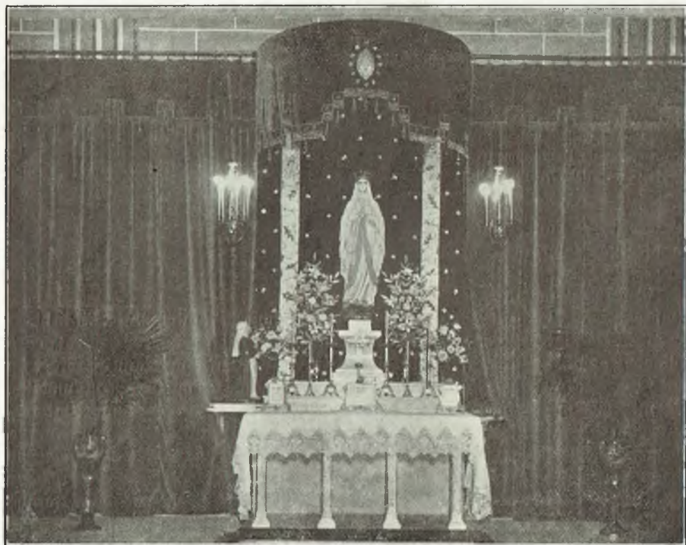
Altar de Nostra Senyora de Lourdes a la parròquia de Breda

G RAN, molt gran ha d'ésser la satisfacció dels bons Bredencs en lograr que assentés el seu Real Tron en aquesta Església parroquial la Verge Blanca, Nostra Senyora de Lourdes; després que molts d'ells, han anat una i altra vegada a postrar-se als peus de la Verge, allà vora el Gave; uns per donar-li gràcies fervents per favors obtinguts, altres per demanar-li mercès i tots